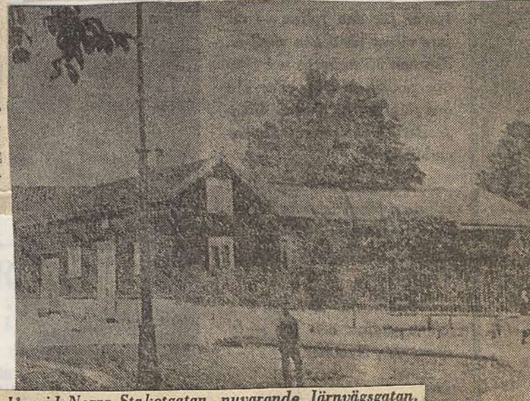
● Gröne vallen när den låg vid Norra Staketgatan, nuvarande Järnvägsgatan.